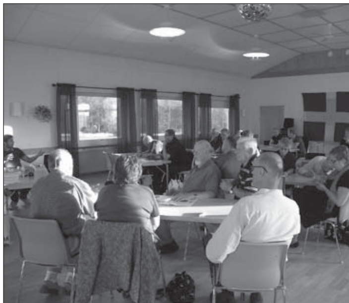
Informationsmötet om VER-DI lockade publik till Fegens bygdegård.